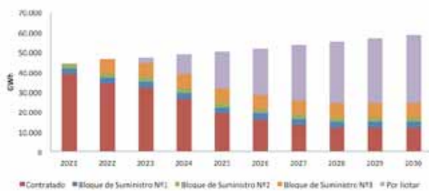
Figura 1: BLOQUES DE SUMINISTRO DE LA LICITACIÓN 2015/01. CHILE. 2021-2030.

Fuente: CNE. El bloque de suministro N° 2 incluye los bloques 2-A, 2-B y 2-C.