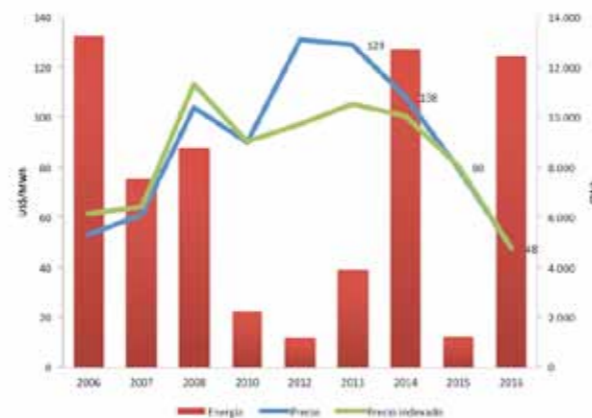
Figura 2: PRECIOS PROMEDIO Y ENERGÍA DE LAS LICITACIONES ELÉCTRICAS. CHILE. 2006-2016.

El 17 de agosto se realizó la adjudicación de la licitación. El precio promedio de la adjudicación fue de 47,6 US$/MWh, que es el menor obtenido desde que se realizan las licitaciones eléctricas en Chile. Si se compara con la licitación anterior, considerada como exitosa en su momento, la disminución del precio es de 40% (ver figura 2). Además, la licitación permite que nuevas empresas se incorporen al mercado eléctrico como Mainstream Renewable Power de Irlanda, WPD de Alemania, y Grupo Iberéolica y Acciona Energy de España. Otro resultado importante, es el alto porcentaje de iniciativas basadas en tecnología eólica y solar. La figura 3 muestra que 46% del suministro contratado proviene de proyectos eólicos y 7% proviene de proyectos solares.